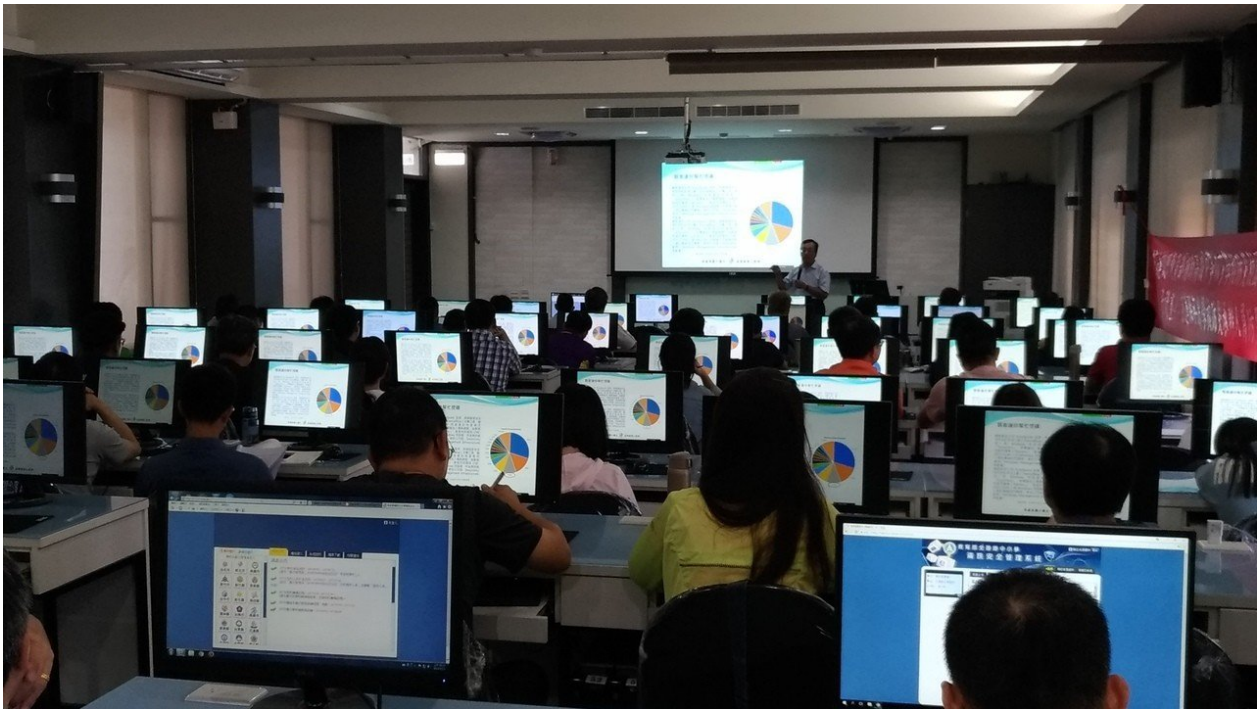
教育部推動「全國國中小資訊安全線上評量系統推廣實施計畫」。